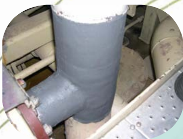
Renforcement des soudures d'un collecteur en T.