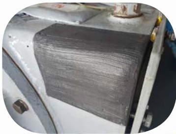
Réparation d'une fissure sur un réservoir d'huile hydraulique

Dream Metal a de multiples utilisations, il peut être utilisé à des faibles températures, il est idéal pour les applications sous-marines, il polymérise sous l'eau, il peut être utilisé sur des parois verticales ou au plafond.